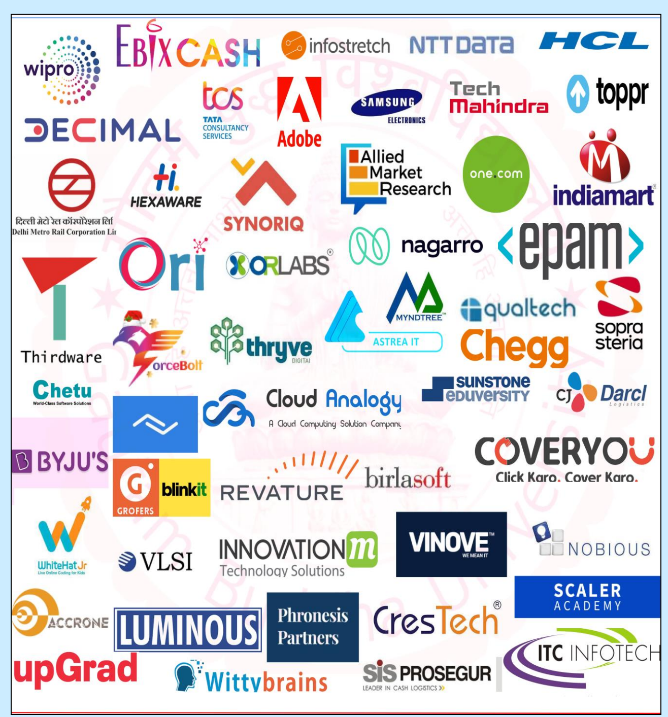
Major Recruiters 2021-22